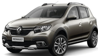
Beige Dune (Versión Intens TM y CVT)