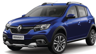
Blue Iron (Versión Intens TM y CVT)