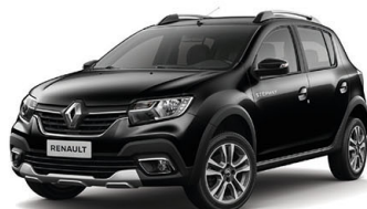
Negro Nacarado (Versión Intens CVT)