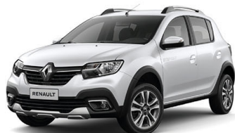
Blanco Glaciar (Versión Intens y Zen TM)