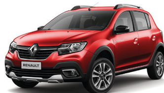
Rojo Fuego (Versión Intens TM y CVT)