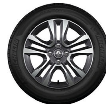
Aluminio 16" diamantados (Versión Intens)