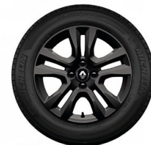
Aluminio 16" (Versión Zen)